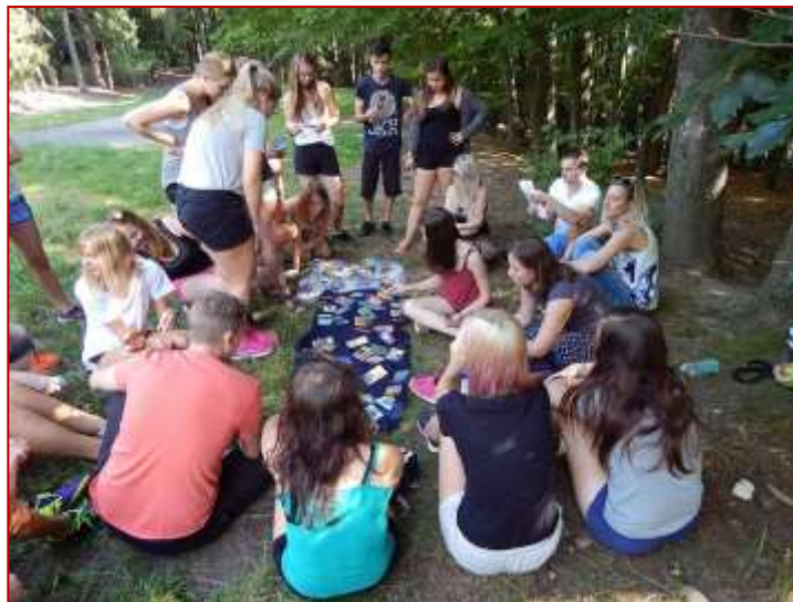
Skupinové aktivity v rámci adaptačních pobytů studentů prvních ročníků.