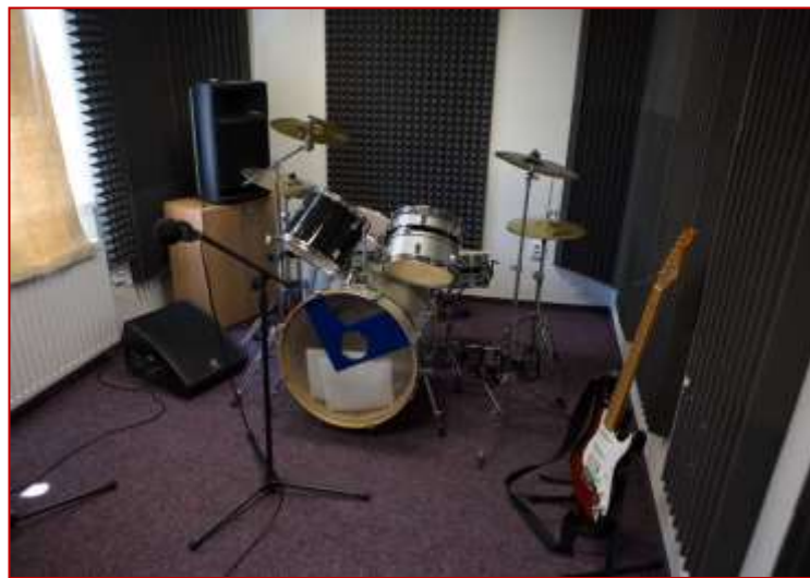
Kontakční místnosti, hudební zkušebna.