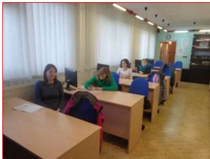
PC kurz pro pokročilé