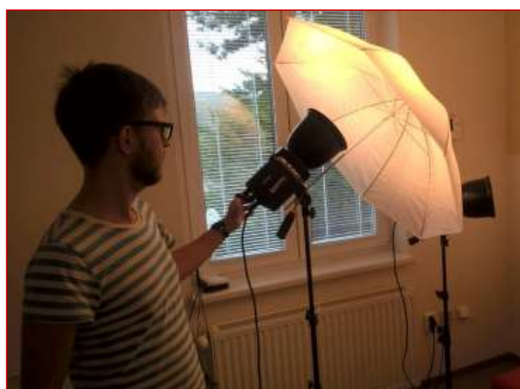
Společné aktivity, Youtube workshop v rámci projektu Zkus to jinak! 2016