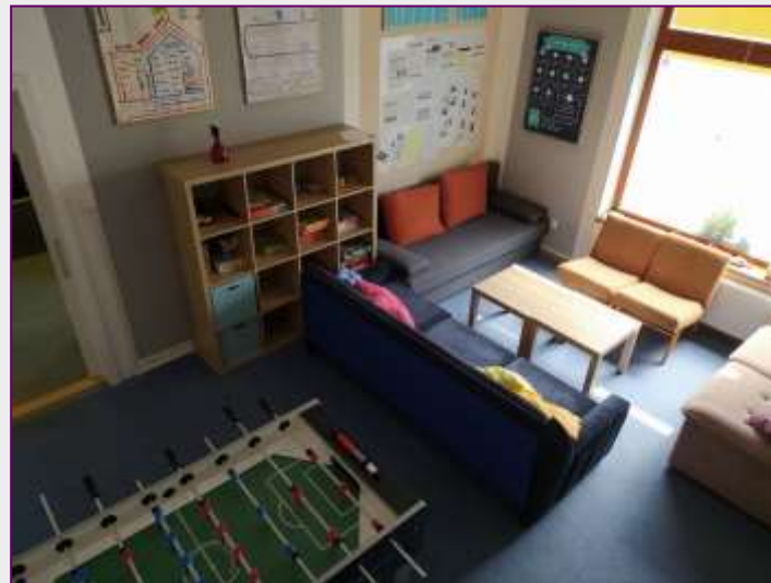
Kontaktní místnost v I. podlaží