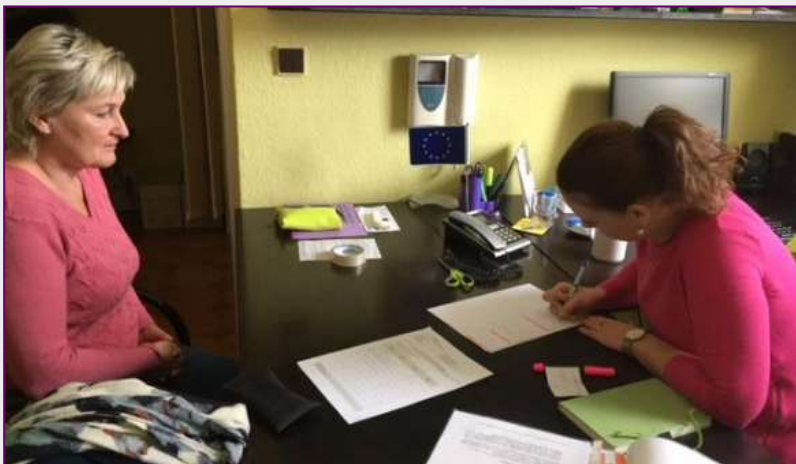
Účastnice projektu při vstupním pohovoru