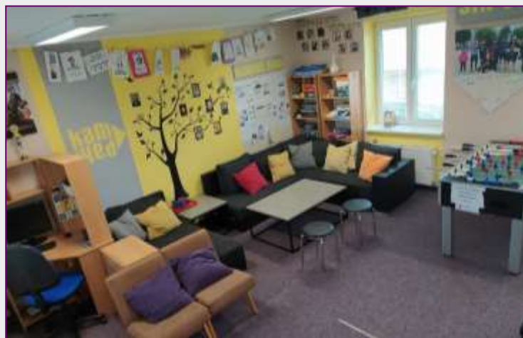
Kontaktní místnosti, herna