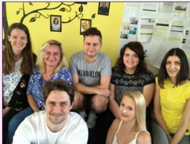
Tým pracovníků v přímé péči

Pokud jde o iniciaci prvních návštěv, nejčastějším důvodem pro prvokontakt byla zkušenost kamarádů, kteří doporučili zařízení dalším. Menší část budoucích uživatelů vyhledala zařízení na základě některého propagačního kanálu: facebook, propagační akce, web. Dále se uživatelé do služby dostali na podnět spolupracujících institucí – nejčastěji kurátora pro mládež a pracovníků terénní služby pro rodiny s dětmi.