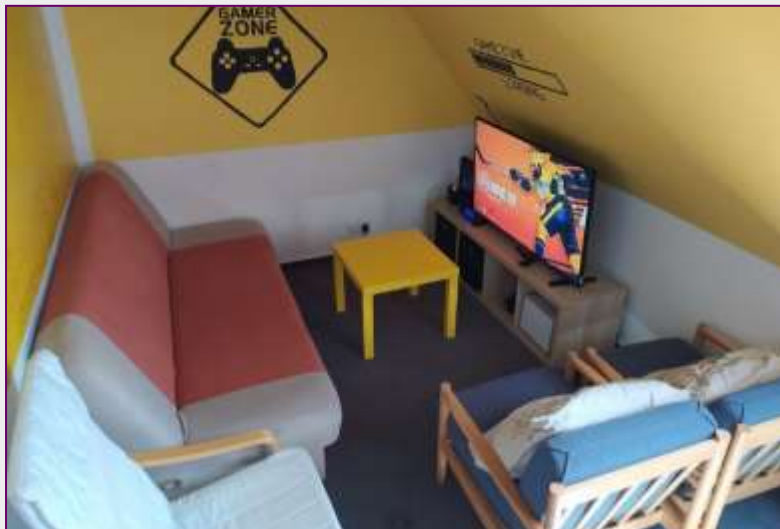
Kontaktní místnost s X-boxem

Klub v Brumově-Bylnici je dostatečně vybaven jak z hlediska volnočasového vybavení, tak i z hlediska zázemí nezbytného pro poskytování sociální služby. V kontaktní místnosti se nachází počítač pro uživatele, projektor, stolní fotbalík, terč na šipky a množství společenských her. V horním patře je umístěn airhockey, herní konzole PlayStation 4 včetně speciálních brýlí na virtuální realitu a „Beauty koutek“ s žehličkou na vlasy a množstvím kosmetiky. K dispozici je rovněž vybavená kuchyňka určená k realizaci tzv. kuchařských dílen a množství výtvarného materiálu. Uživatelé mají možnost bezplatného připojení na Wi-Fi síť.