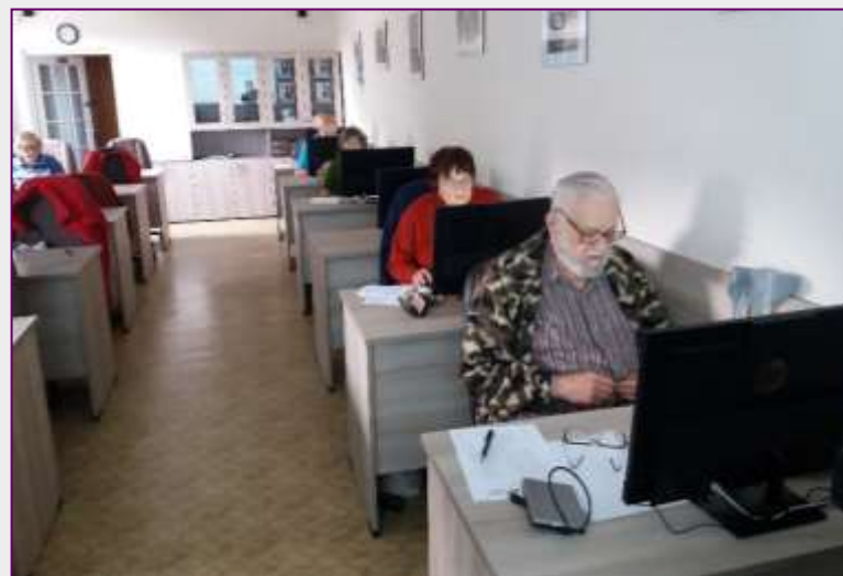
PC kurz pro seniory