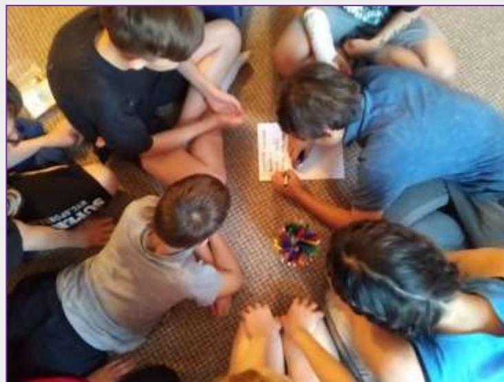
Zkus to jinak! 2019 – aktivity na víkendkách