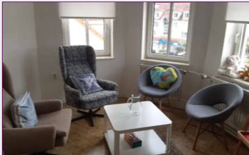
Pracoviště Valašské Klobouky