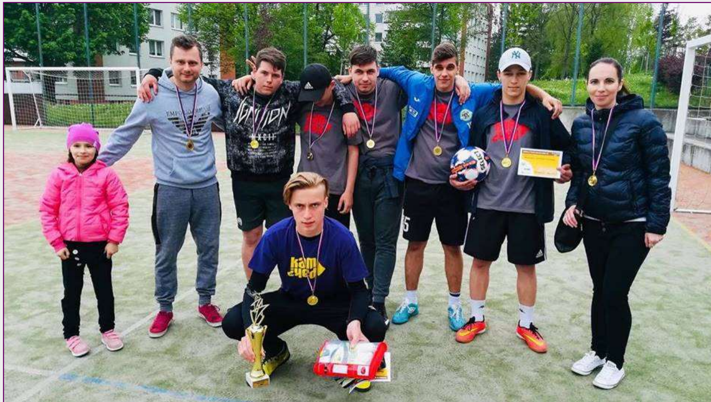
Vítězný tým fotbalového turnaje nízkoprahových klubů Zlínského kraje za rok 2019 – KamPak?

V průběhu roku si v našich prostorách našlo stabilní pozici poradenské centrum Zebra, se kterým sdílíme kancelář a dvě konzultační místnosti. V souvislosti s rozšiřováním jeho prostor došlo k rekonstrukci doučovací místnosti a přeměně Youtube studia na konzultační místnost. Klub byl také ve spolupráci s uživateli vymalován. Do kontaktní místnosti byly pořízeny nové konferenční stolky, kosmetický koutek a herní místnosti se dočkaly nových sedacích prvků. Za zmínku stojí rovněž naše čtvrtá účast v řadě na turnaji NZDM Zlínského kraje v malé kopané, na kterém jsme letos dokázali zvítězit a přivést tak zlaté medaile.