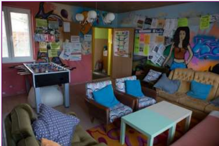
Kontaktní místnost s fotbálkem