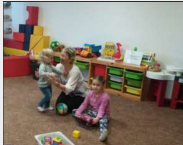
Účastnice projektu na pracovišti