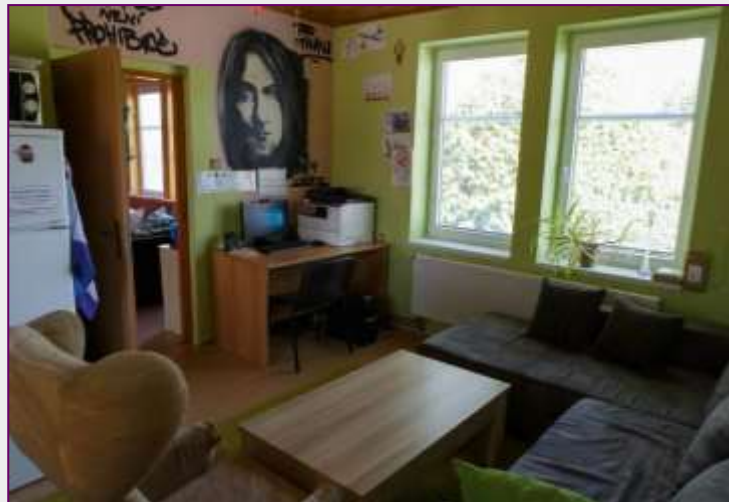
Kontaktní místnost s kuchyňkou a uživatelským PC