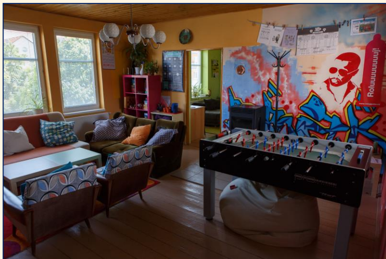
Kontaktní místnost s fotbálkem