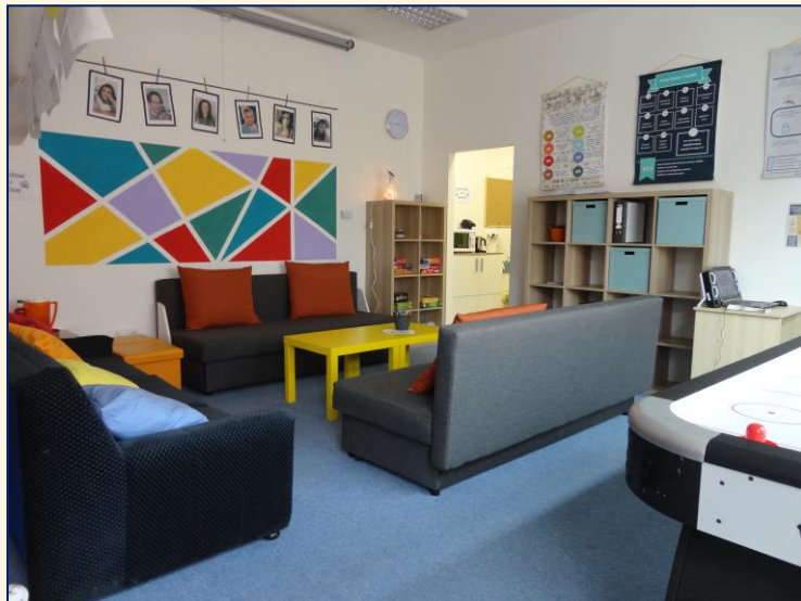
Kontaktní místnost v I. podlaží