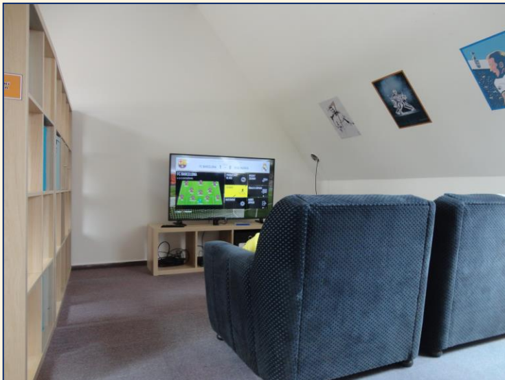
Kontaktní místnost s X-boxem