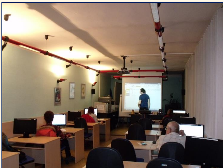
PC kurz pro pokročilé

V roce 2017 o.p.s. realizovala další kurzy v oblasti informačních technologií. Byly zaměřeny na získání dovedností v práci s PC na pokročilé úrovni - zdokonalování znalostí a dovedností v oblasti operačního systému Windows, programu MS Office, zejména pokročilé funkce programů Word, Excel, Power Point a Outlook a práce s internetem. Dále kurz zohledňoval i využívání chytrých telefonů a tabletů ve spojení s počítačem, práci s multimédií apod. Cílovou skupinou byly zejména pracovní aktivní osoby - zaměstnanci okolních firem, kteří prohloubení dovedností využívají v zaměstnání, ale zúčastnili se i aktivní senioři.