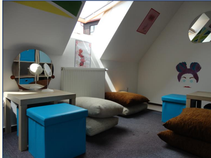
Kontaktní místnost v II. podlaží s „beauty koutkem“