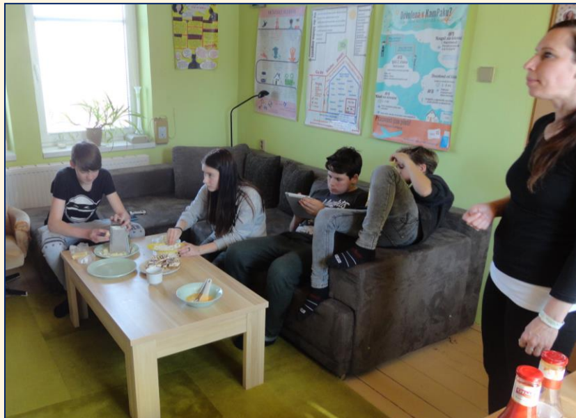
Zkus to jinak! 2017 – víkendovky, kuchařské dílny