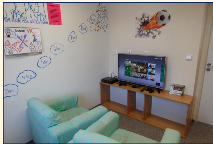
Kontaktní místnosti, herna, Youtube studio