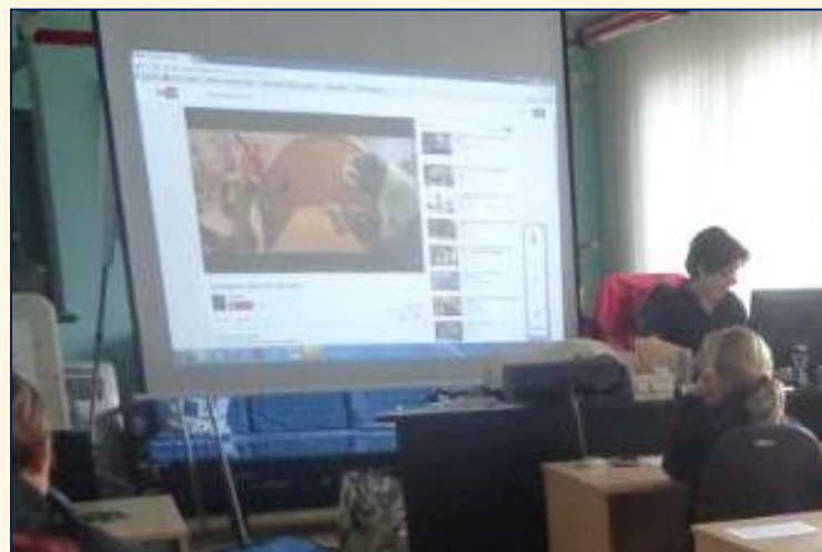
Kurz první pomoci