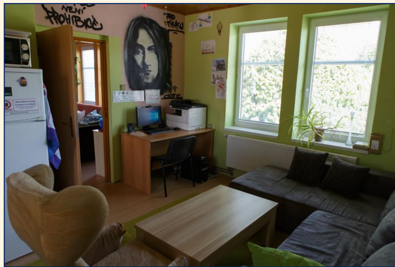
Kontaktní místnost s kuchyňkou a uživatelským PC